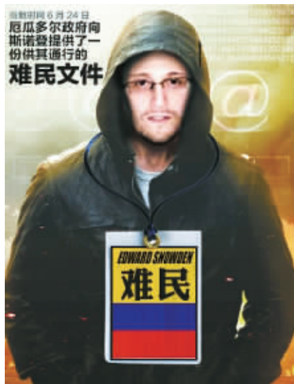
当地时间6月24日，厄瓜多尔政府向斯诺登提供了一份供其通行的难民文件。