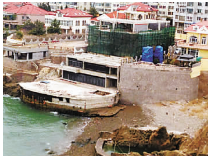
海景别墅豪华程度令人咋舌。