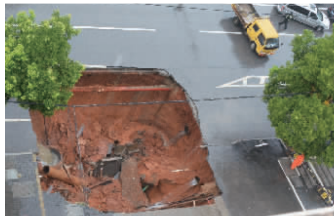
6月28日早上，湘潭市河东大道靠近宝塔路口的这处路面塌陷，形成一个巨坑。

日晟花园小区居民称，塌方开始并不大，上午10点左右塌方加剧，面积增大。塌方造成附近商铺和住户家停水。事发后，河东大道主干道从双拥路