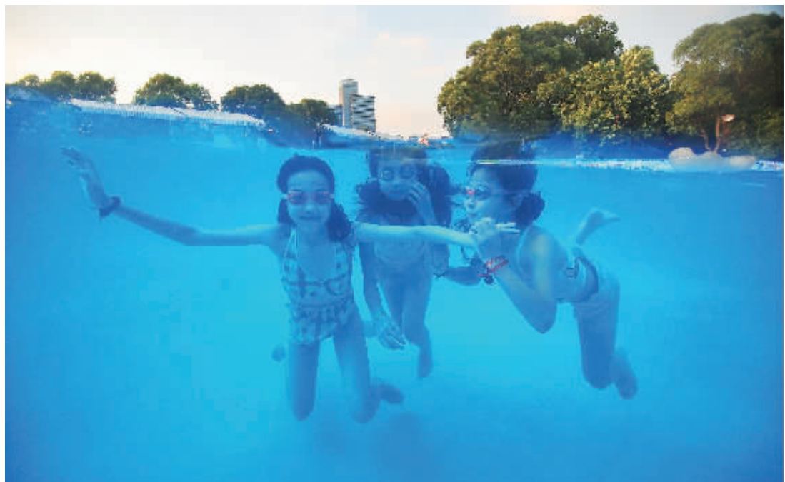
6月18日, 湖南烈士公园东门“动漫水世界”户外泳池, 三个小女孩在享受水中的清凉。

不过, 专家强调, 一两次的高温观测的数据并不具有科学性和权威性, 确定一个城市的热力中心, 需要几年甚至更长的数据观测结果才能得出一个科学的结论, 另外造成热力中心的原因也只有周详的科学考察后才能得出结果。