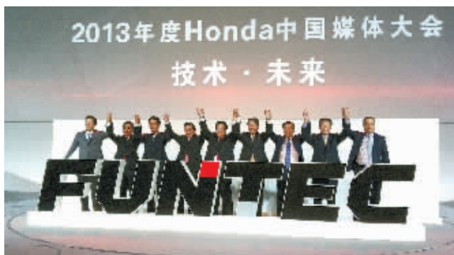
2015年之前,Honda将会投放12款Honda品牌新车型。

上周五,本田中国联合广汽本田和东风本田在北京举行了“2013年度Honda中国媒体大会”。会上,本田发布了最新的技术路线图,并宣布将加速推进本地化进程等一系列最新举措。本田计划到2015年推出12款车型,实现2015年产销130万辆。