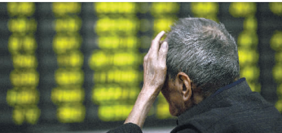
股民在一家证券营业部内关注股市行情,6月13日,沪深股市双双大跌。