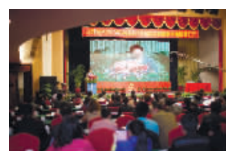
资料图/2013年华中(长沙)首届口腔种植学术会议现场 美奥口腔承办。

此次除了专题讲座,美奥口腔还将邀请权威种植专家团队为您亲诊。他们都是种植适应症把握、微创种植、即刻种植等方面的权威专家。目前,长沙美奥口腔医院已经开通专家亲诊的“绿色通道”,缺牙患者只需要拨打0731-89912222申请预约,就能不出国内享受权威专家亲诊的高端口腔诊疗服务。