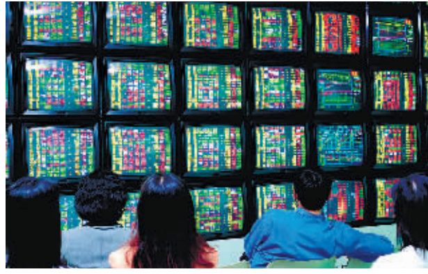
S天海成功完成股改后暴涨又大跌,部分股民被套。(资料图片)

对于尚未完成股改的个股,张占峰认为尚未股改的公司复牌后是否能够上演报复性上涨的走势,应区别对待:一是看市场大环境是否配合,二是看公司本身的质地和市场认同度。 ■记者 黄文成