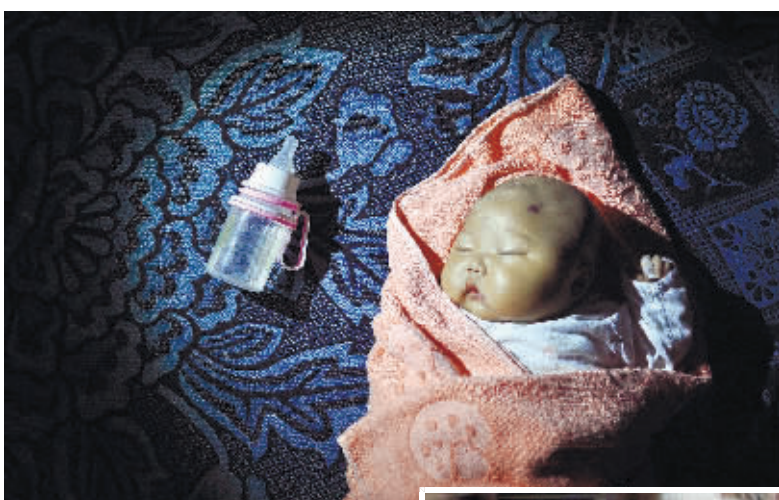
被遗弃的婴儿和她的奶瓶。

了三分钟,才把孩子和塑料袋一起放下,从袋子里翻出一个奶瓶,给孩子喂了点东西。两分钟后,他站起身来,刚迈出一小步,又重新蹲下,往孩子身边的袋子里放了点东西,再次给她喂了点吃的。