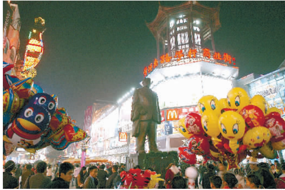
梦想地的快乐。

骑龙大街营销负责人认为,市州购买力功不可没。随着这两年区域交通的大提升,一小时交通生活圈成为现实,省会长沙与13市州的对接日趋紧密。特别是随着家庭轿车日益普及、生活水