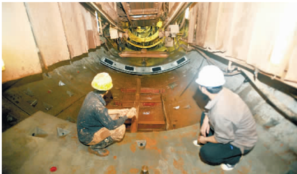
高速发展的长沙正向1.5线城市迈进。

在我国的城市阶梯中,京、沪、穗、深算是一线城市中的一线,而众多的省会城市算是二线,地级城市则是三线城市。“等级线”俨然成了城市规模和实力的直观注解。所以,当业内权威机构说“一线城市正被1.5线城市逼近”的时候,所有心怀远大的二线子民,都期待“奔一”的帽子戴在自己头上,长沙当然不例外。