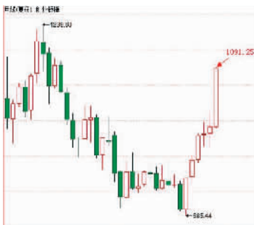
创业板指数月线“六连阳”已是板上钉钉。

“光头”的大阳线。在相对高位出现一颗如此漂亮的大阳线,是否意味着创业板指数已进入“最后的疯狂”?