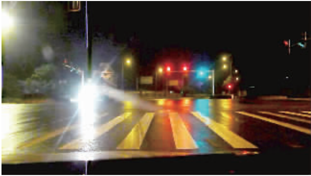
5月8日凌晨, 长沙市劳动西路与古曲北路交会口, 一辆水泥罐车径直闯红灯。(视频截图)