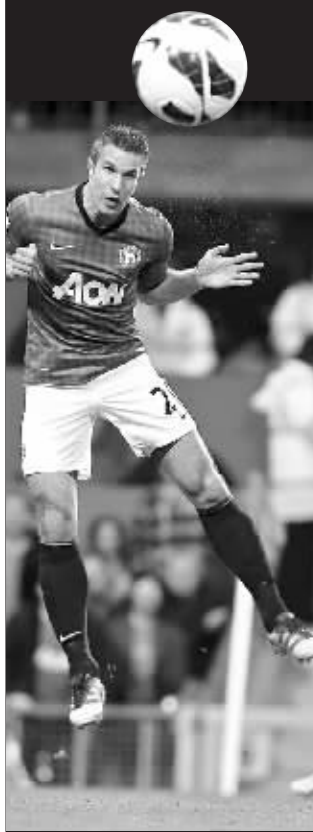
范佩西今晚回阿森纳主场。