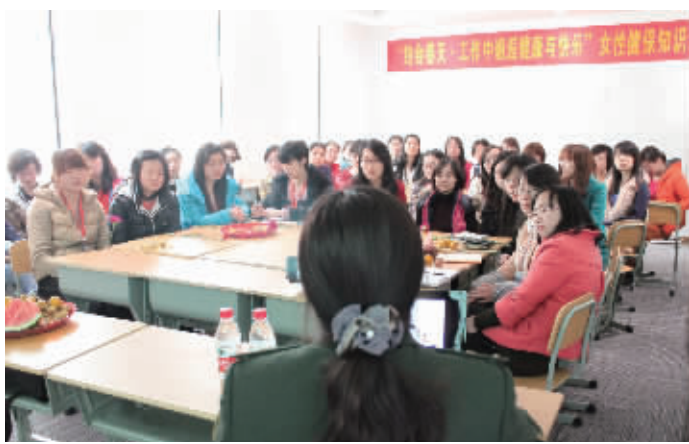
为提高职场女性健康意识,武警医院专家走进各大企业进行科普讲座和发放公益体检表。

为进一步提高女性健康意识,普及女性健康知识,4月29日至5月5日,在湖南省妇女联合会等单位的大力支持下,武警