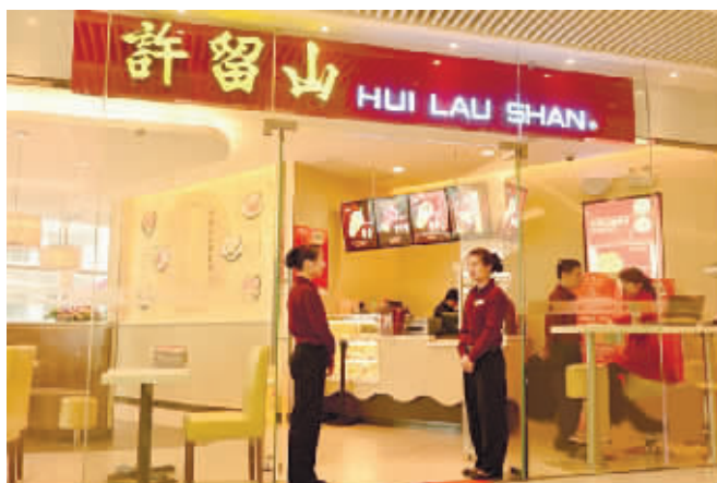
“许留山”甜品长沙店外观。(资料图片)