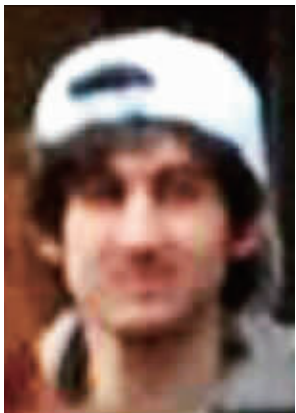
涉嫌制造波士顿爆炸案的两名嫌疑人。