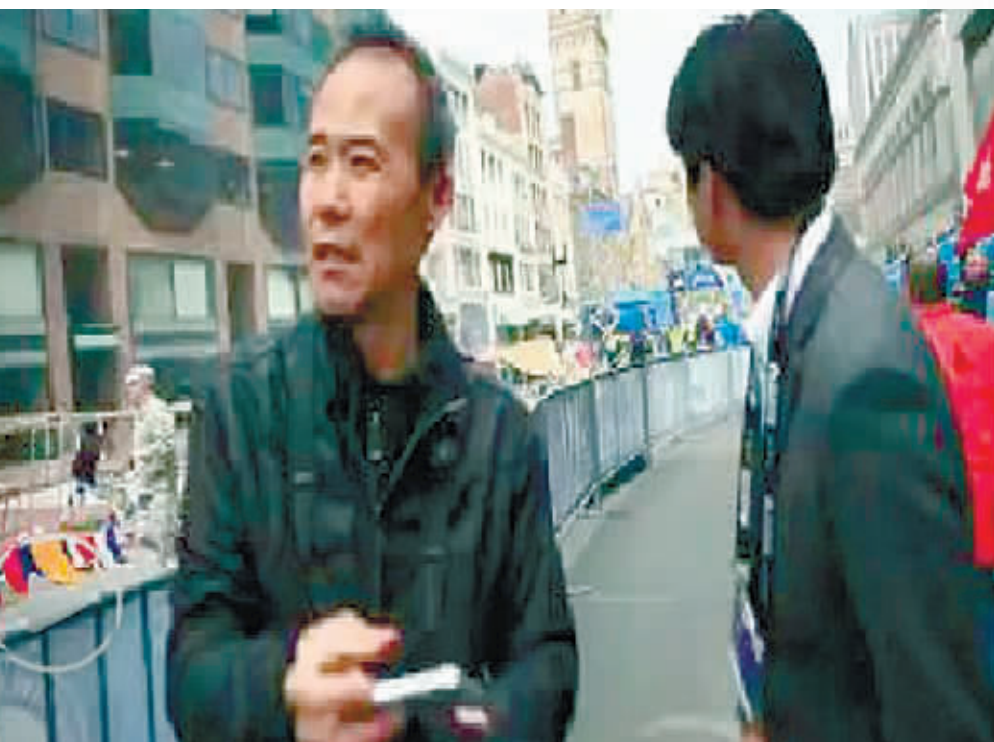
当地时间4月15日下午,率队参赛的万科董事长王石正在现场。(视频截图)