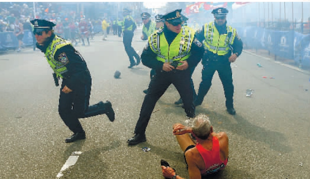
美国波士顿马拉松比赛现场15日遭遇连环爆炸。由于参赛人数超2万人，且赛道周边聚集不少观众，爆炸造成严重人员伤亡。

美国警方表示，目前尚无任何嫌疑人被捕。华盛顿当局说，没有任何人或组织声称对这次爆炸事件负责。