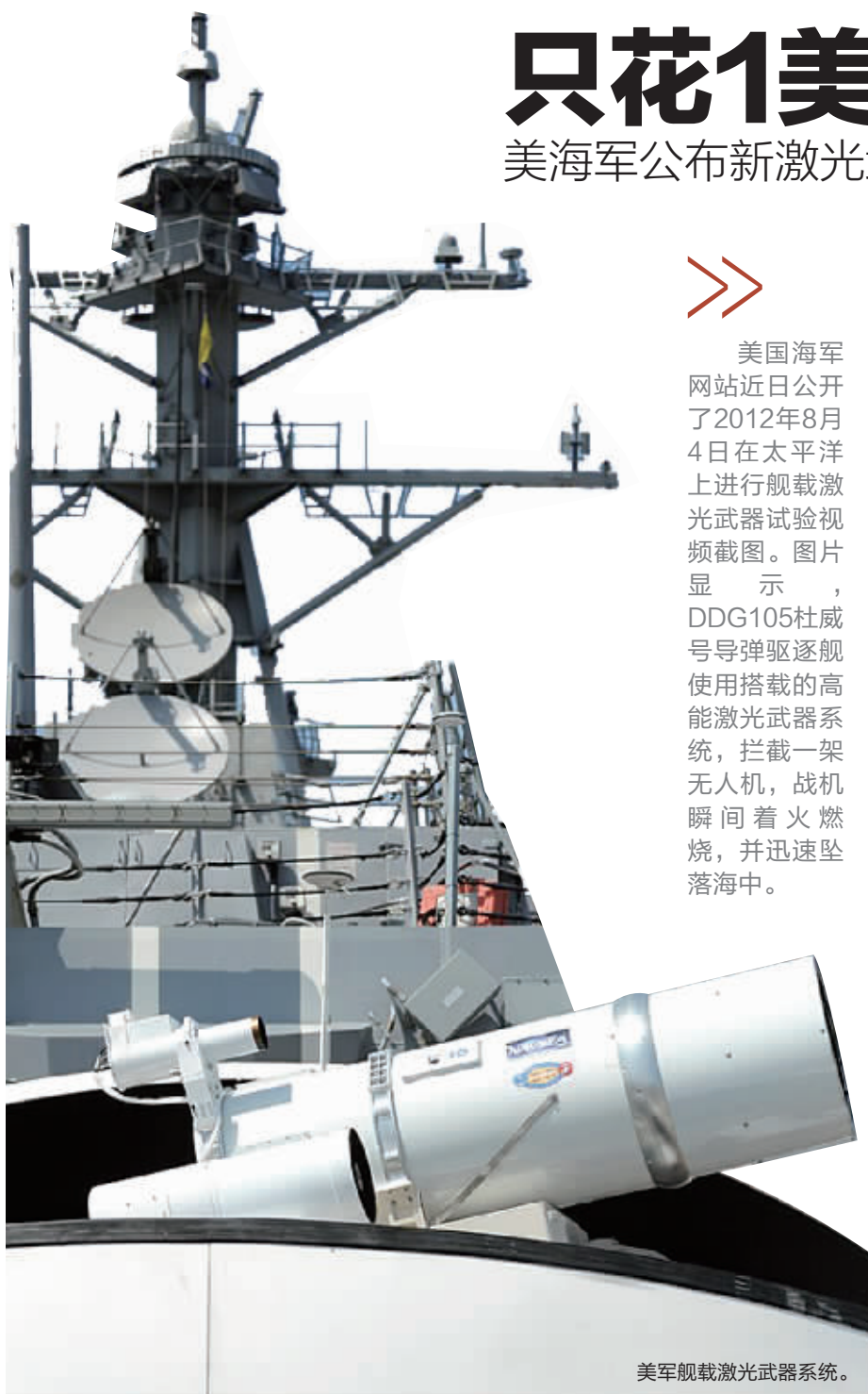
美军舰载激光武器系统。