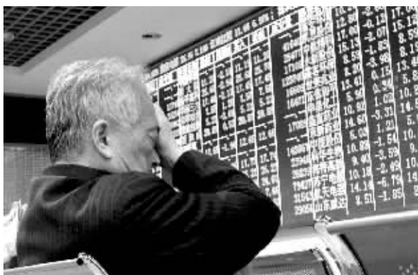
创业板在4月2日一路下挫,为近1年来的最大单日跌幅。