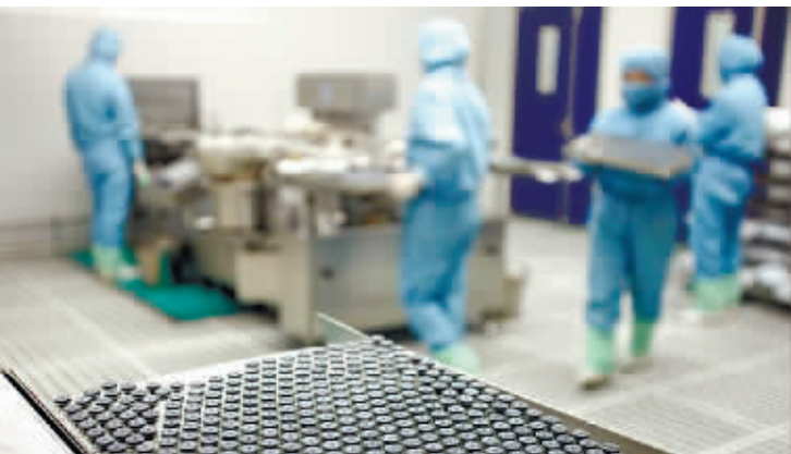
近日,H7N9禽流感来袭,生物疫苗概念股闻风暴涨。