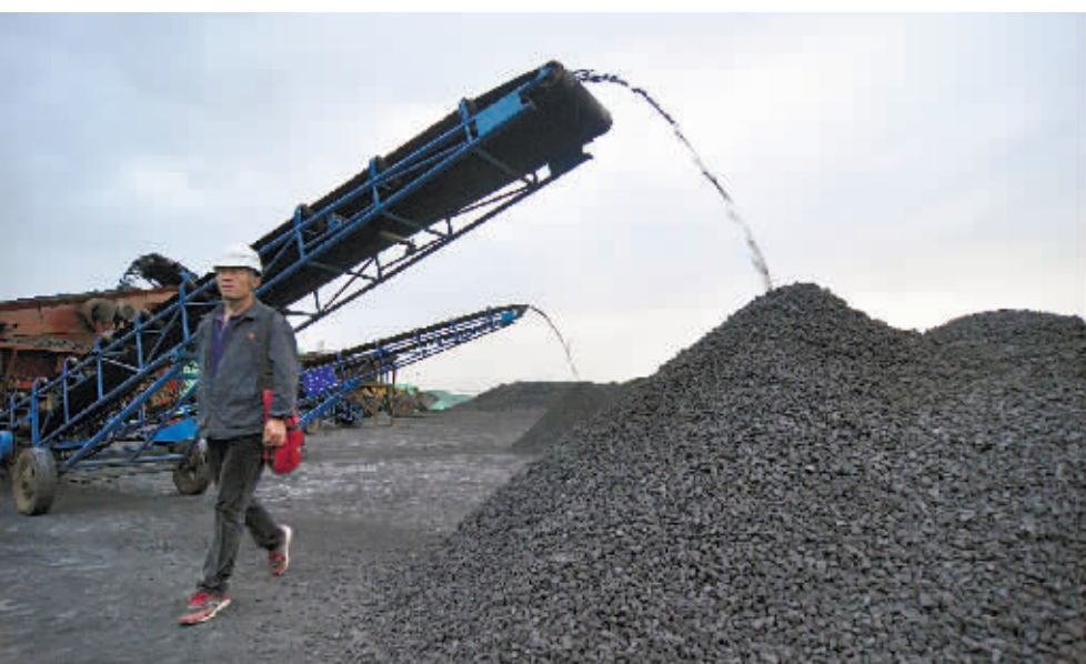
今年首个期货新品种焦煤期货于3月22日正式挂牌上市。

焦煤期货上市获得证监会批准，于3月22日正式挂牌上市，这也是今年首个期货新品种上市。按以往新的期货品种上市的惯例，在A股的相关公司往往会迎来一波短期炒作。但此次焦煤期货上市，相关板块却表现相当“淡定”。