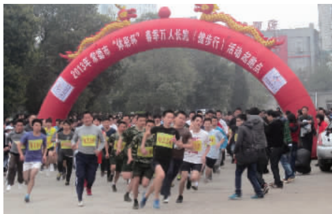
常德市“体彩杯”万人长跑活动 集体的体彩公益金大量用于“全 民健身计划”和“奥运争光计 划”的实施,从体育场馆的建 设、专业运动员的训练保障、大 型体育赛事的举办,到各项群 众体育文化活动的开展,都有 体彩公益金的支持。