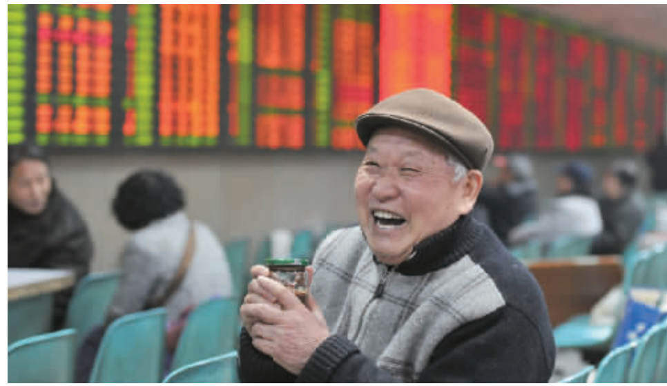
3月20日,证券交易大厅,股民喜笑颜开。