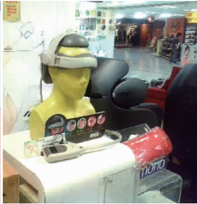
商场里的助眠产品五花八门。

“不想失眠?那我只能失业”,王婷,26岁的长沙职场丽人,几乎每晚都睡不好,加班无止境,节假日成空,睡觉时间一再压缩,过度紧张的神经导致了严重的失眠。