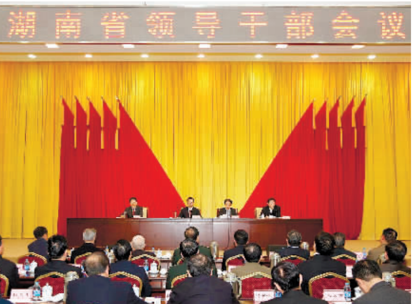
湖南省领导干部会议现场。