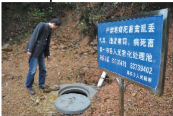
浏阳市葛家村的死猪无害化处理池,池内还有几头未腐的猪尸。

湖南一年约死240万头猪,死亡率正常 全省对乱弃死猪“零容忍”,一律采取“土葬”