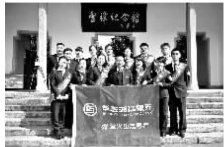
华融湘江银行热心公益事业。

据了解,“得利宝”周末理财产品将在每周五晚8点发行。购买该项理财产品的投资者不仅可以享受交通银行推出的购物、加油及手机充值等“最红星期五”品牌系列优惠活动,还可通过网上银行和手机银行参与投资理财。 ■通讯员 蒋浩 记者 朱蓉