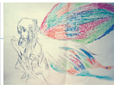
网友晒出自己的上课纸条。