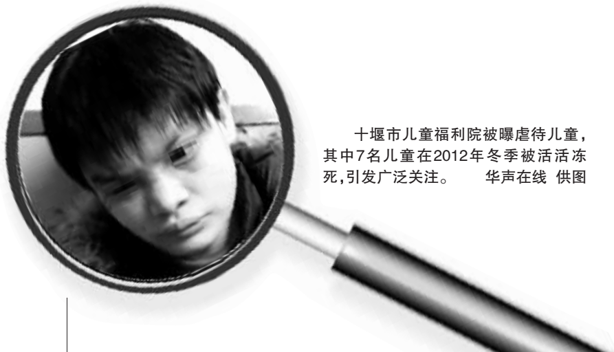
十堰市儿童福利院被曝虐待儿童,其中7名儿童在2012年冬季被活活冻死,引发广泛关注。

十堰市表示,工作组仍正在全面深入调查网帖反映的内容,相关调查结果将在第一时间向社会公布,如有关人员存在失职渎职行为将严格依法依规追究责任。 ■记者 罗浩