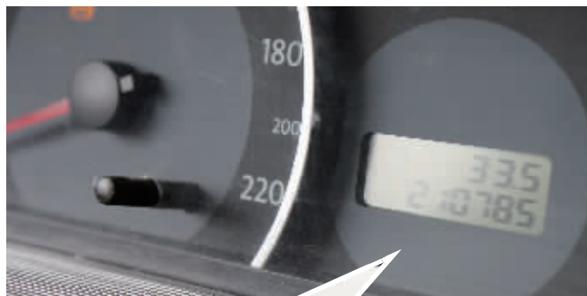
25日下午，记者从株洲收费站到李家塘收费站，里程表显示33.5公里，收费站收取18元。

以李家塘收费站至株洲北收费站高速公路为例，计费里程为43.473公里，一是主线里程为21.732公里；二是连接线长20.741公里，其中包括长沙绕城高速公路黑石铺至李家塘收费站段9.946公里；三是匝道里程1公里。