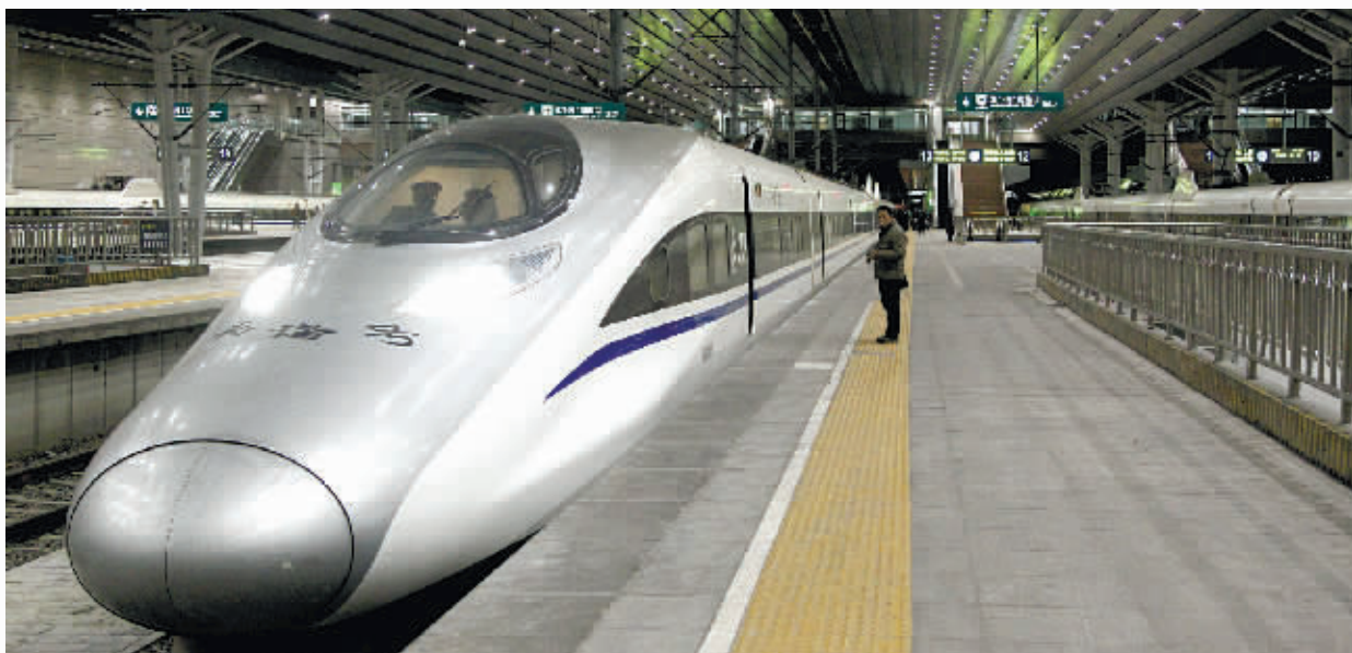
高铁驶出,满载着买房生力军。