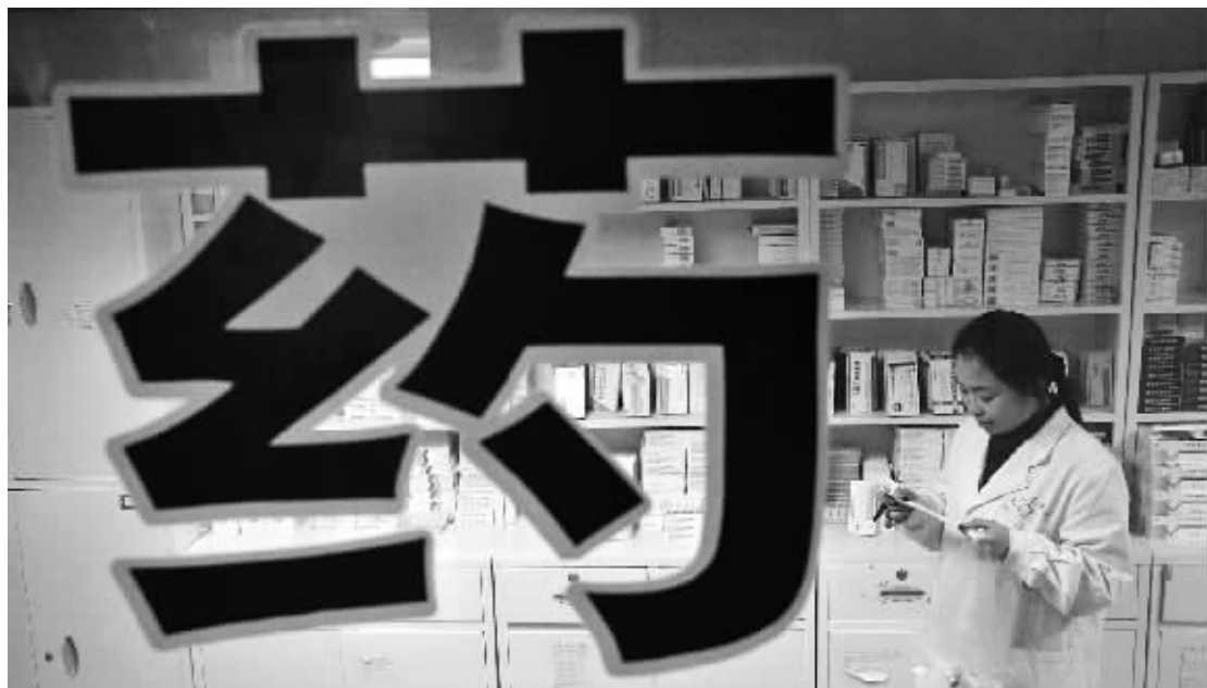
合理降药价让百姓看得起病。但省政协委员直指目前一些怪现象：药品中间流通环节加价推高药价。

他介绍，“中间环节太多导致药价虚高，还有的药品利润小就不生产了。可减少药厂数量，强化优质资源。”