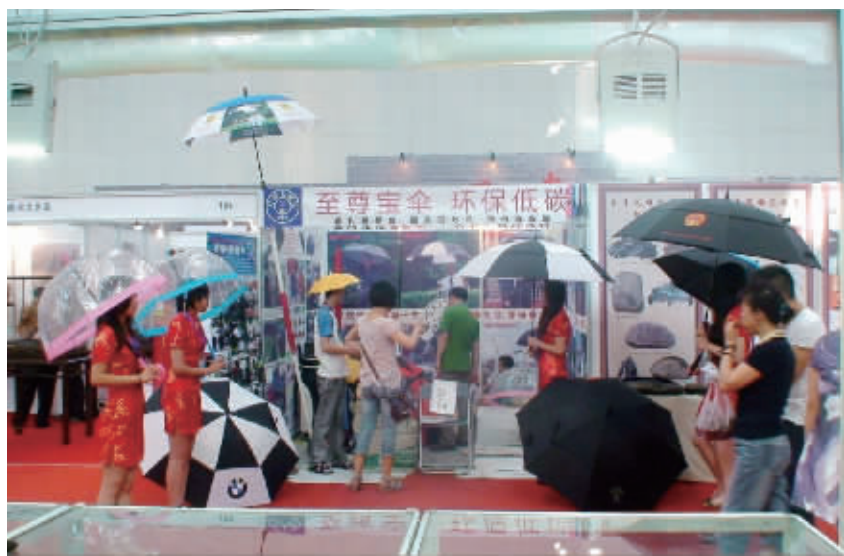
将在年购节上展示的智能伞。

伞是人们出行的必备之物,雨雪天要打雨伞,艳阳天要打太阳伞,可你用过既是雨伞又是阳伞的高级智能伞吗?1月23日—2月4日,只要你来到2013红星年货购物节展会,就能见到这种新奇玩意。