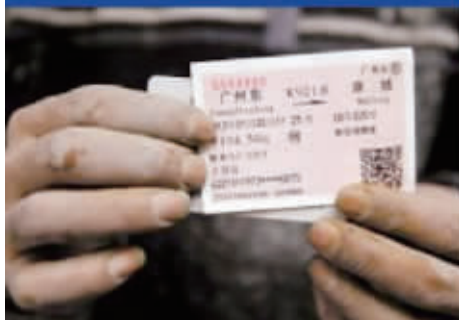
他们的站票和咱们的座票花的是一样的价钱。