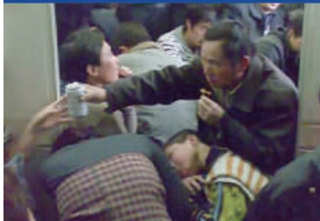
他们大多不会上网买票，也不懂电话订票。