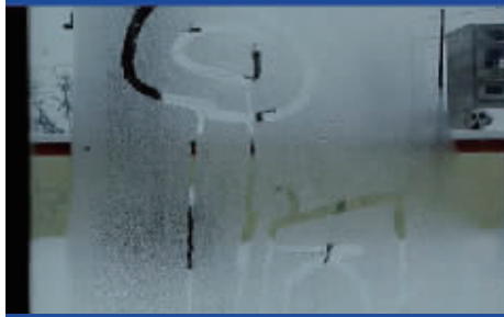
多一份理解，多一份感动，多一份爱……