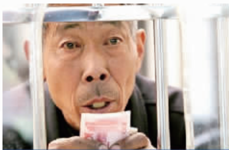
他们买到一张票不容易。