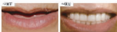
缺牙会凸显人的苍老现状，种植牙之后会显得更年轻