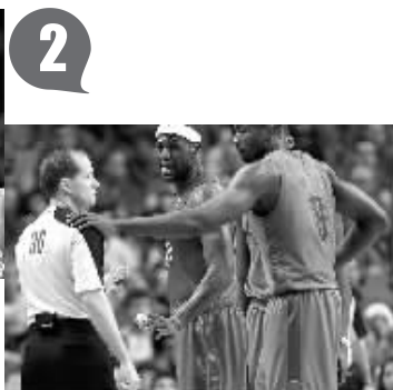
听说你的秋衣质量不错。