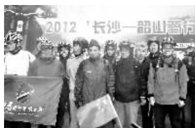
骑行者出发前合影。

出发后,骑行队伍将沿着东方红广场(长沙)—坪塘镇—莲花镇—花明楼(宁乡)—毛泽东铜像广场(韶山)的线路骑行,预计全程80公里,耗时7小时左右。到达韶山毛泽东铜像广场后,骑行队员向毛泽东铜像敬献了花篮。江岸表示,本次骑行活动不仅是为