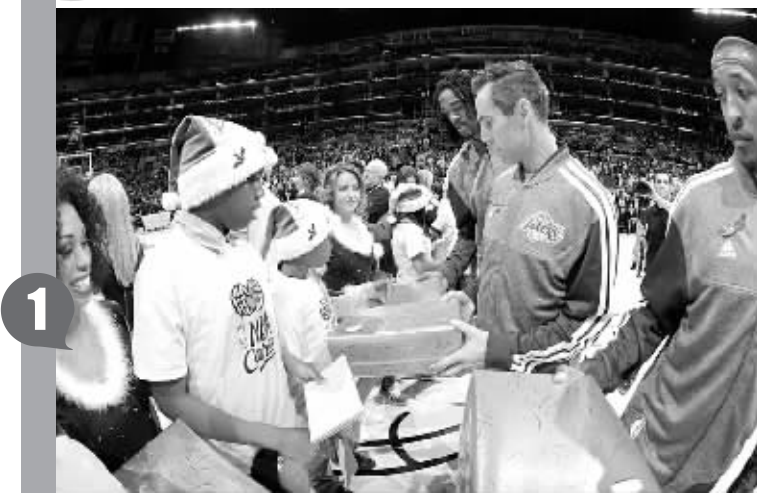
圣诞节天气冷,美国到处都在发放秋衣。