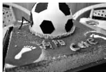
没有考核,足球永远只能是“舌尖上的足球”。

中国足球该学学我们单位的饮水机,程序设定好,电源一插上,不管哪个领导值班,一直有100℃的开水喝。 ■刘涛