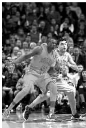
还有一种寒冷叫秋裤太短。