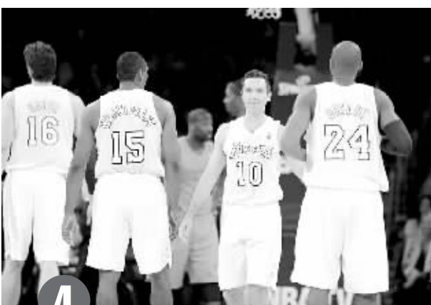
圣诞节,秋衣男模的节日。