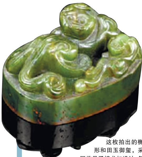
这枚拍出的椭圆形和田玉御玺，采用回首母子螭龙扣设计，玺上螭龙接近螭虎形。

据联合国教科文组织统计，流失到中国境外的中国文物约164万件，分散在全世界47家博物馆，海外民间的收藏预计是馆藏的10倍。流失海外的文物几乎涵盖所有文物种类。而近年来，中国文物成了海外拍卖市场的抢手货，价格动辄上千万甚至上亿。而借助拍卖中国文物，拍卖行也趁机大发其财。