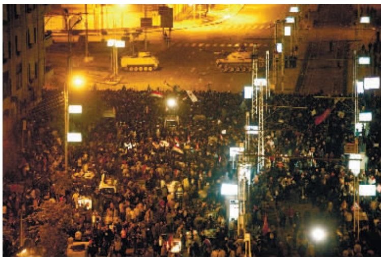
12月6日,在埃及首都开罗,大批示威者被坦克和铁丝网阻拦在总统府外不得靠近。

穆尔西11日宪法声明引发支持与反对者多次冲突。开罗总统府附近5日晚爆发冲突,至少6人死亡、700多人受伤。