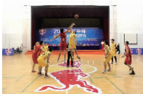
长株潭男篮对抗赛激战中。

随着2012—2013赛季NBA以及CBA陆续开打,中国的篮球迷们如沐春风,特别是当麦蒂、阿里纳斯等一众NBA巨星加盟CBA后,CBA也变得更有影响力与看点,上午看完精彩的NBA,晚上能继续欣赏CBA。今晚的CBA赛场,众多国内外篮球明星纷纷率领自己球队争胜,最有看点的无疑是麦蒂所在的青岛对阵佛山。