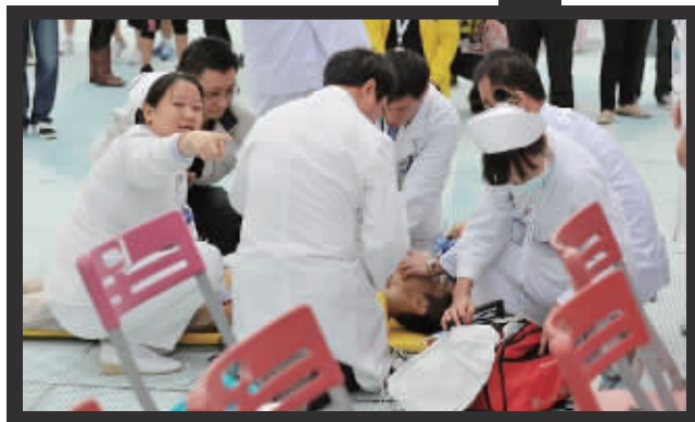
医护人员现场抢救比赛中倒地的选手。