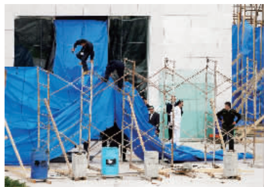
11月27日，在约旦河西岸城市拉姆安拉，工作人员站在巴已故领导人阿拉法特墓地挖掘现场。

钋的半衰期是138天，假如阿拉法特是因钋而死，因当时未对其做尸检，就错过了最佳时机。虽然阿拉法特个人用品上的钋含量很高，但这并不足以确定他的死因。