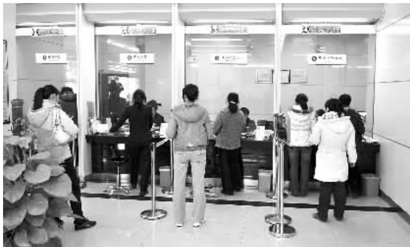
临近银行下班时间,仍有很多客户在等待办理业务。