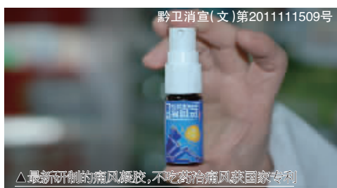
最新研制的痛风凝胶,不吃药治痛风获国家专利

上海中医药大学的科学家研究霍氏五子方时,偶然发现这种生物酶。继而由苗仁堂实现了这种酶透皮吸收的稳定性。因为对痛风治疗有奇效,将其起名为“霍氏痛