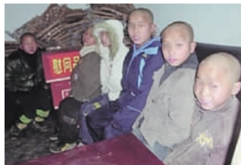
今年1月,“闷死”的5名男童在毕节七星关区民政局安置点与另一名流浪儿的合影。(资料图片)