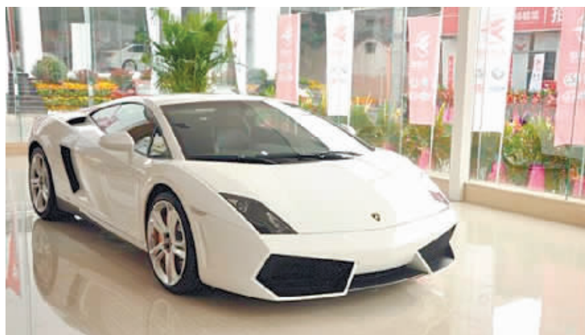
顶级豪车兰博基尼亮相798城市展厅。

(9+2)期间揭牌成立,目前已有400多家会员单位。商会会员企业主要涉及银行、航空、房地产、零售、电力、矿产开采、日用百货、食品、机械制造、家用电器、建材、纺织等行业。自2002年以来,广东在湘投资合作项目共9830个,实际到位资金达1803亿元,广东企业在湘投资占湖南省实际利用内资总额的37.5%,年增