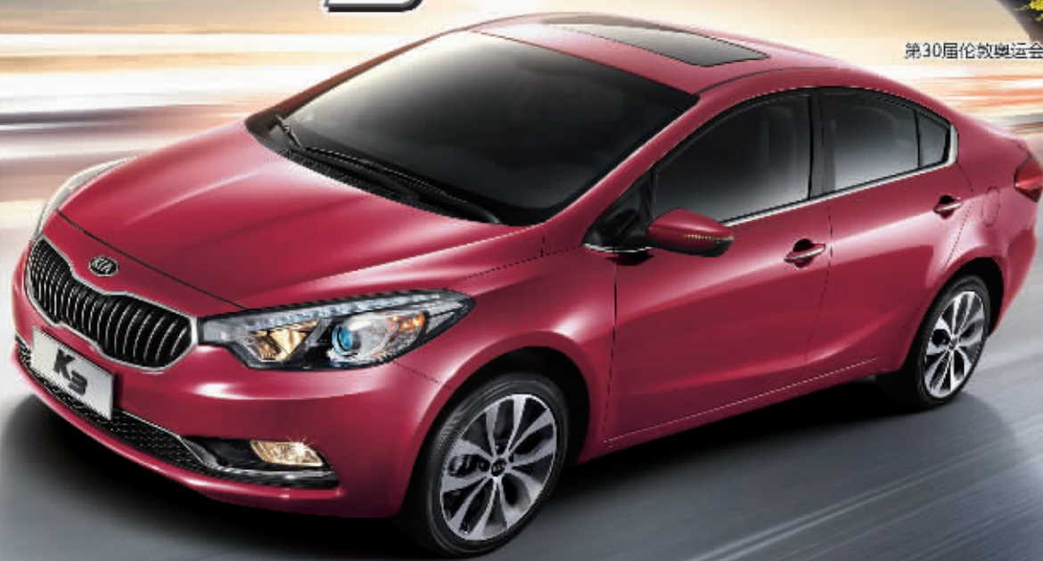
第30届伦敦奥运会乒乓球冠军 张继科