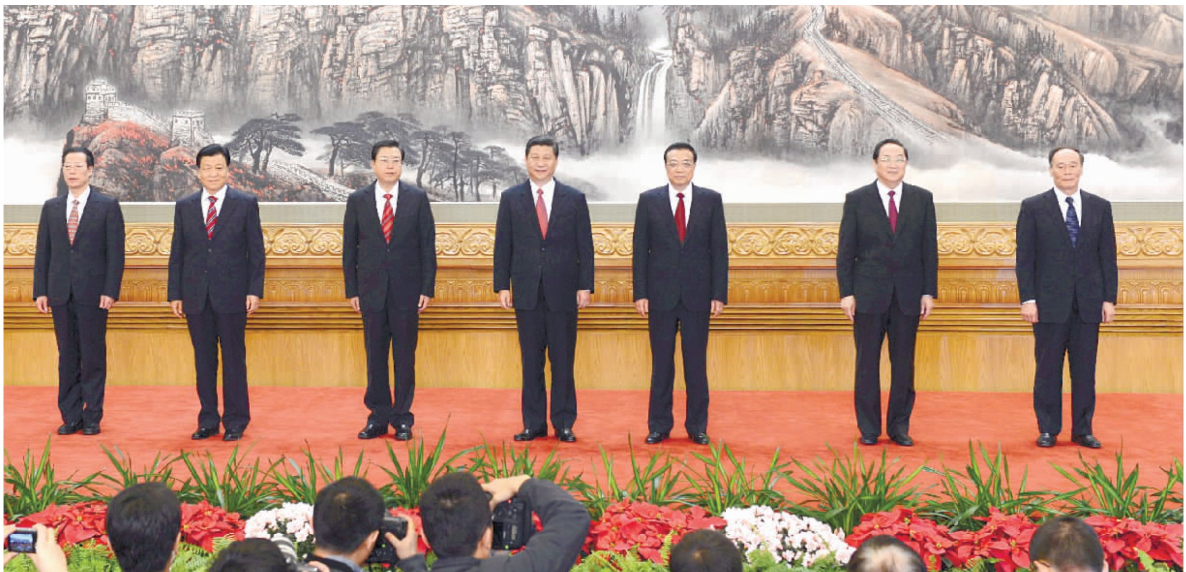
11月15日，刚刚在党的第十八届中央委员会第一次全体会议上当选的中共中央总书记习近平和中共中央政治局常委李克强、张德江、俞正声、刘云山、王岐山、张高丽在北京人民大会堂同采访十八大的中外记者亲切见面。