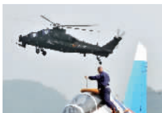
武直-10闪耀珠海航展。