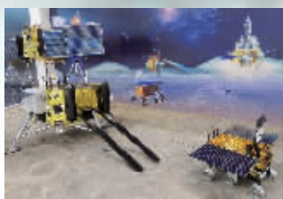
“嫦娥三号”实物模型。