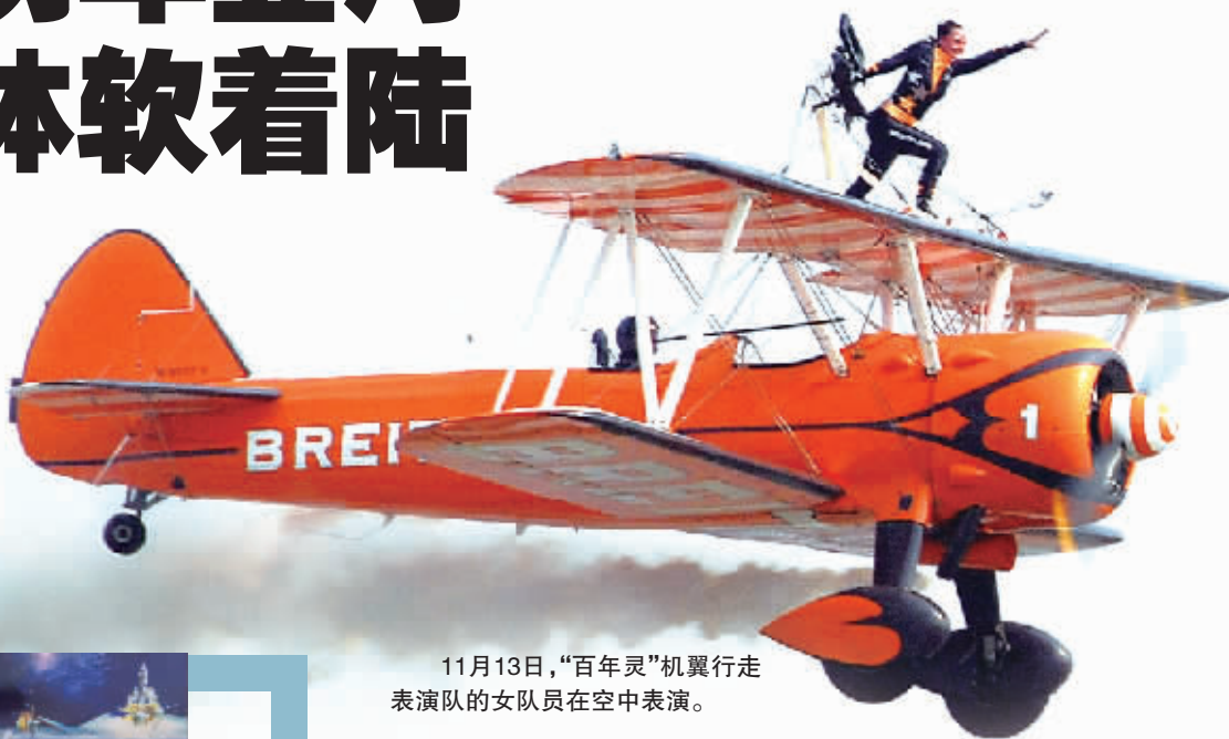
11月13日,“百年灵”机翼行走表演队的女队员在空中表演。