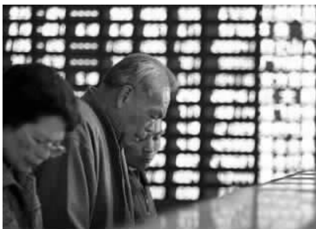
炒股切忌盲目跟风，否则很容易被套。

新上市的浙江世宝曾在上周五“狂刷”了一把A股纪录，一时风光无限。然而，本周却遭遇“滑铁卢”，连续两日剧烈震荡，在炒新监管“高压”下，最终均以跌停收盘。在如此“冰火两重天”的走势之后，被浙江世宝深套的股民无奈地给它取了个外号“中石油兄弟”。 ■记者 黄文成