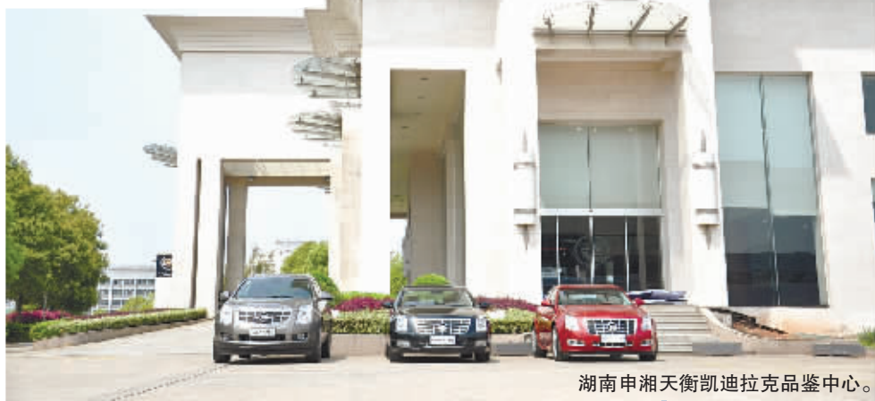
湖南申湘天衡凯迪拉克品鉴中心。