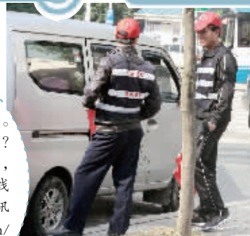
11月2日,长沙蔡锷北路路口,两名执勤的驾考学员躲在一辆面包车后闲聊。

考驾照,必须上街当劝导员。对于这样的驾考新规,你怎么看?遇到“实习”劝导员的不文明行为,你有什么想说的?请拨打本报热线0731-84326110, @本报新浪、腾讯微博,或登录 http://cs.voc.com.cn/ (长沙网)发表自己的看法。