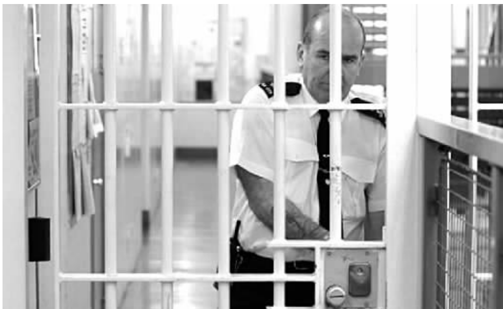
近年来,平均每周都有一名罪犯被英国监狱系统错误释放。